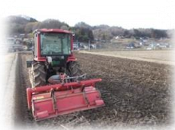
折衷苗代の耕うん