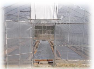
太陽シートで被覆