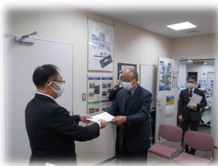
県北農林事務所にて