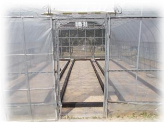
プール育苗の木枠設置